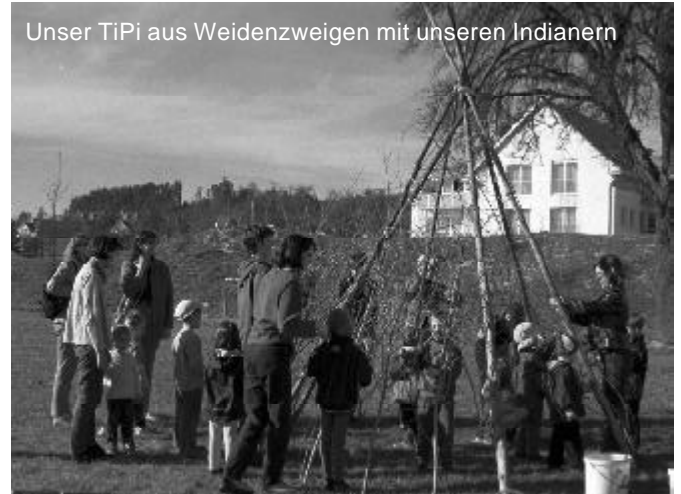
Unser TiPi aus Weidenzweigen mit unseren Indianern