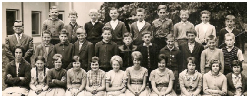
Der Jahrgang der Oberstufe im Schuljahr 1962/63

Viel Spaß beim Erraten der Namen, die Auflösung finden Sie in der Topothek!