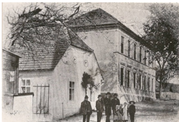
Alte und neue Volksschule 1902, Besitzerin: Renate Hanner

Zur Tilgung der Bauschulden wurde für jeden in der Gemeinde verbrauchten Hektoliter Bier eine Steuer von 2 Kronen beschlossen.